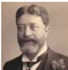
Francesco Paolo Tosti